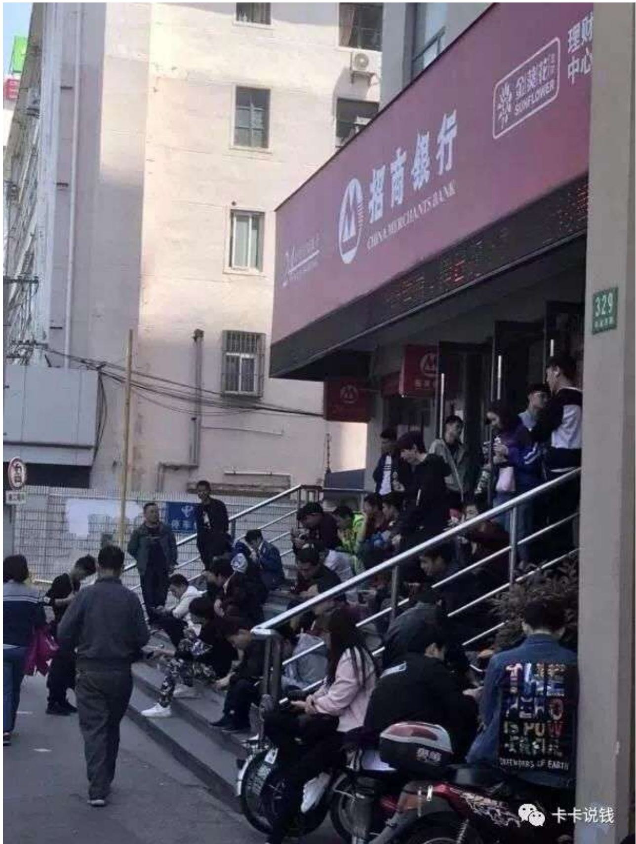
六、招行撸卡人坐牢 小撸怡情，大撸伤身，强撸灰飞烟灭。