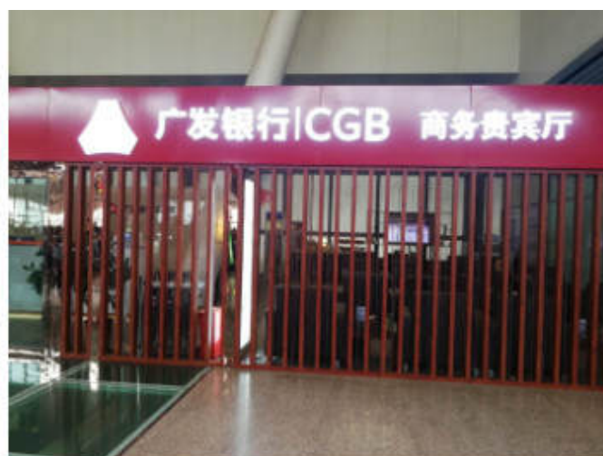
广发与悦途出行合作的贵宾室

还有些高铁站，目前还没有广发冠名的休息室，但可根据高铁站的实际情况，使用广发赠送的龙腾卡，进入由龙腾出行提供的高铁休息室。如南昌西站，就是右龙腾