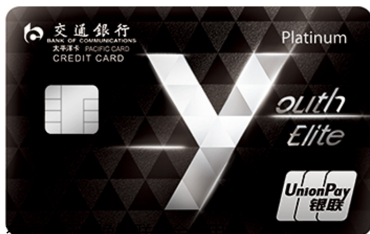
交通银行信用卡银联白金信用卡

交通银行：12月31日前，每周五5点开始，交通银行信用卡持卡人在本来生活app购物，使用交通银行信用卡（买单吧）支付，单笔订单消费实付金额满99元及以上，可享受立减20元优惠。每个活动日限量1500个名额，名额有限，抢完即止，单卡单个活动日限参与一次。