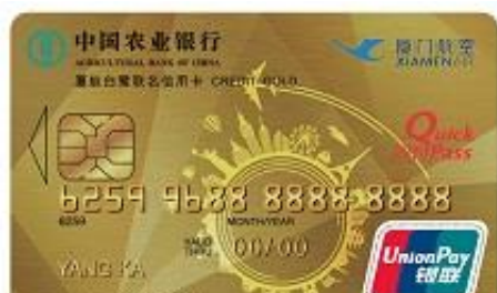
农行厦航白鹭联名信用卡(银联，人民币，金卡)

农业银行：12月31日前每周五，农行借记卡（信用卡暂不支持）翼支付绑卡用户使用翼支付进行消费，可享受满50立减10元，每位用户每周可参与1次。每月限前60000名用户。