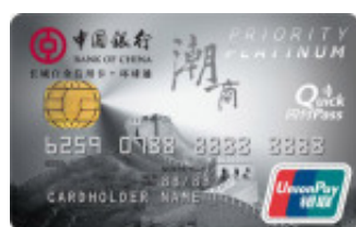
0011 长城潮商白金信用卡