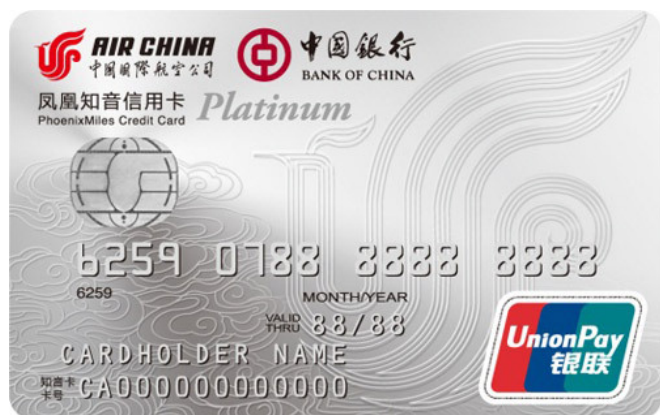
0028 凤凰知音国航中银银联白金卡