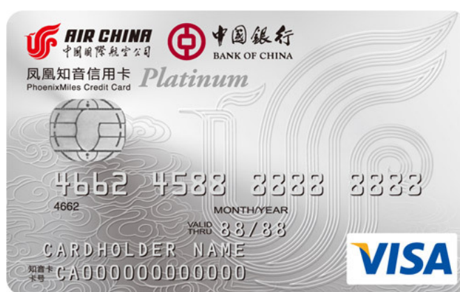
0029 凤凰知音国航中银威士白金卡

----这两张卡日常消费12:1累积国航里程，境外双倍，年度境内机票酒店类消费满1w人民币赠1000里程。