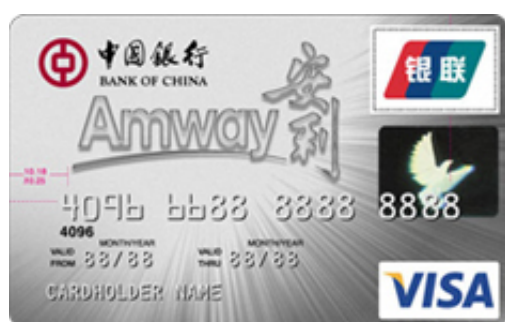
0111 中银威士安利白金卡（精英版）（仅限广东）