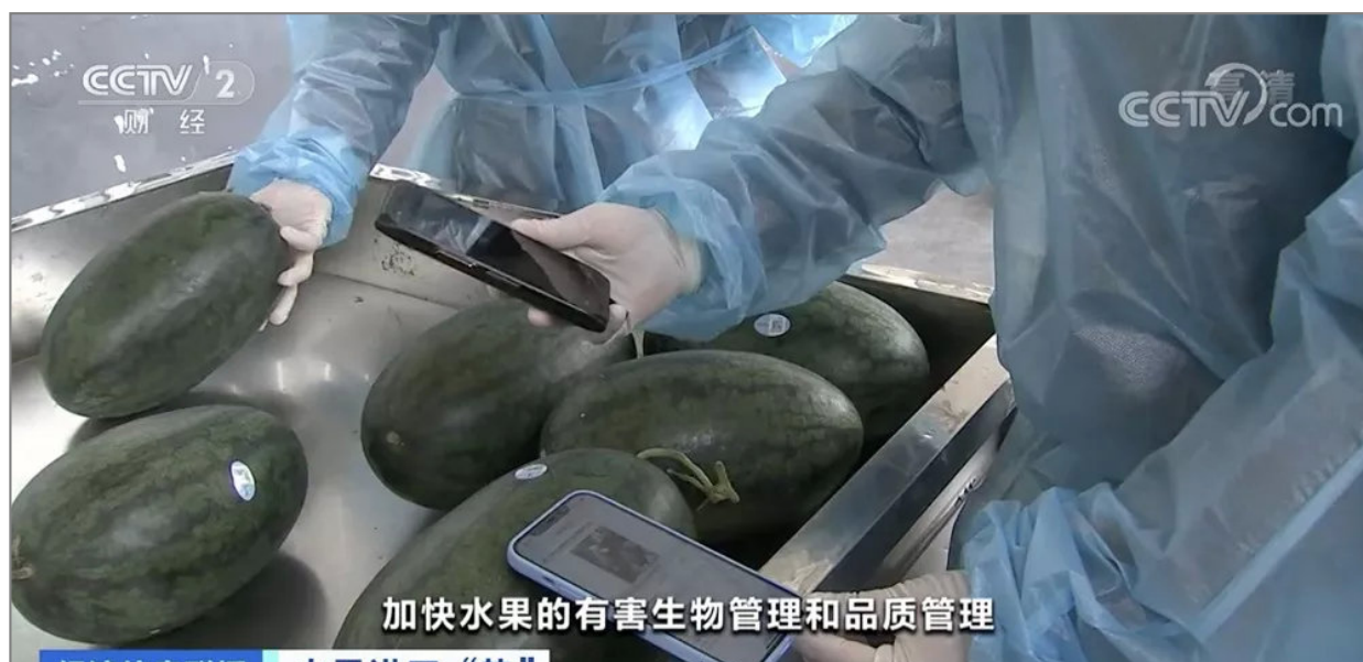
加快水果的有害生物管理和品质管理

经济信息联播 水果进口“热” 记者注意到，从车上卸下的榴莲、西瓜上面，都贴着一张小小的溯源码，用手机扫描之后，果园位置、进口商及进境口岸信息一应俱全。查验关员告诉记者，半个月之后就将迎来水果旺季，他们此刻已在着手准备。