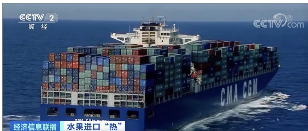
经济信息联播 水果进口“热”

经济信息联播 水果进口“热” 记者注意到，从车上卸下的榴莲、西瓜上面，都贴着一张小小的溯源码，用手机扫描之后，果园位置、进口商及进境口岸信息一应俱全。查验关员告诉记者，半个月之后就将迎来水果旺季，他们此刻已在着手准备。