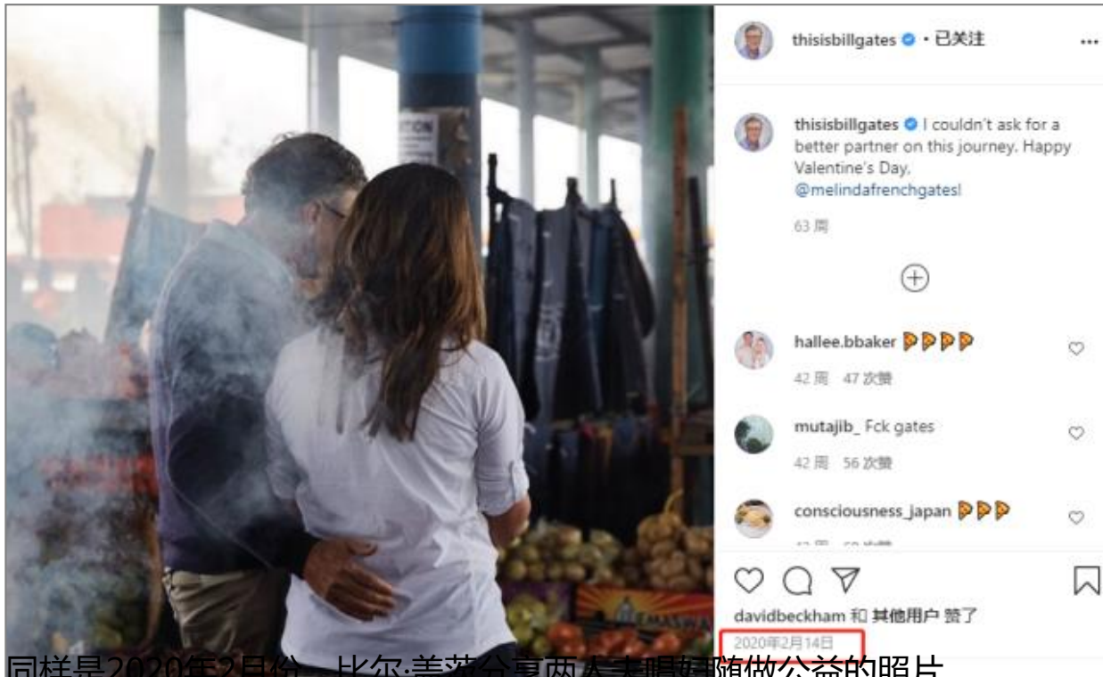
同样是2020年2月份，比尔·盖茨分享两人夫妻随做公益的照片。

2020年1月2日(当地时间1月1日)，是两人结婚26年纪念日，梅琳达晒出两人一起跳舞的照片，祝福这个会让他一辈子这样跳舞的人纪念日快乐。