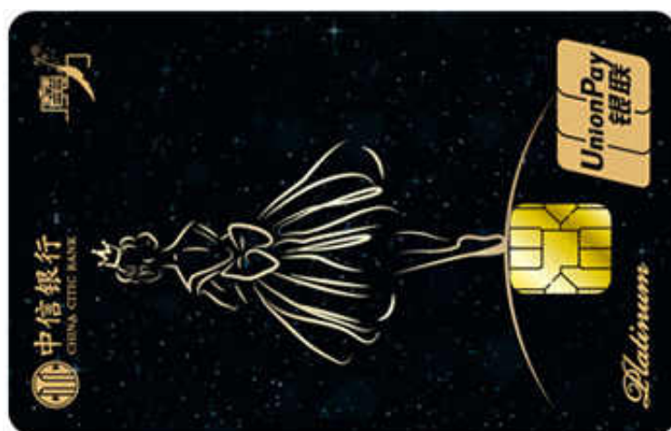
中信银行魔力爱白金信用卡星空芭蕾