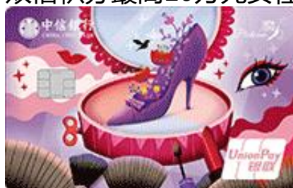
中信银行魔力爱白金卡（潘多拉）