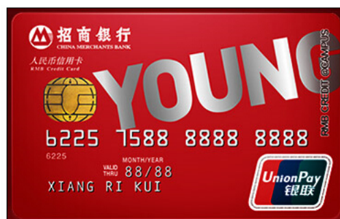
招商还有这个：英雄联盟主题的