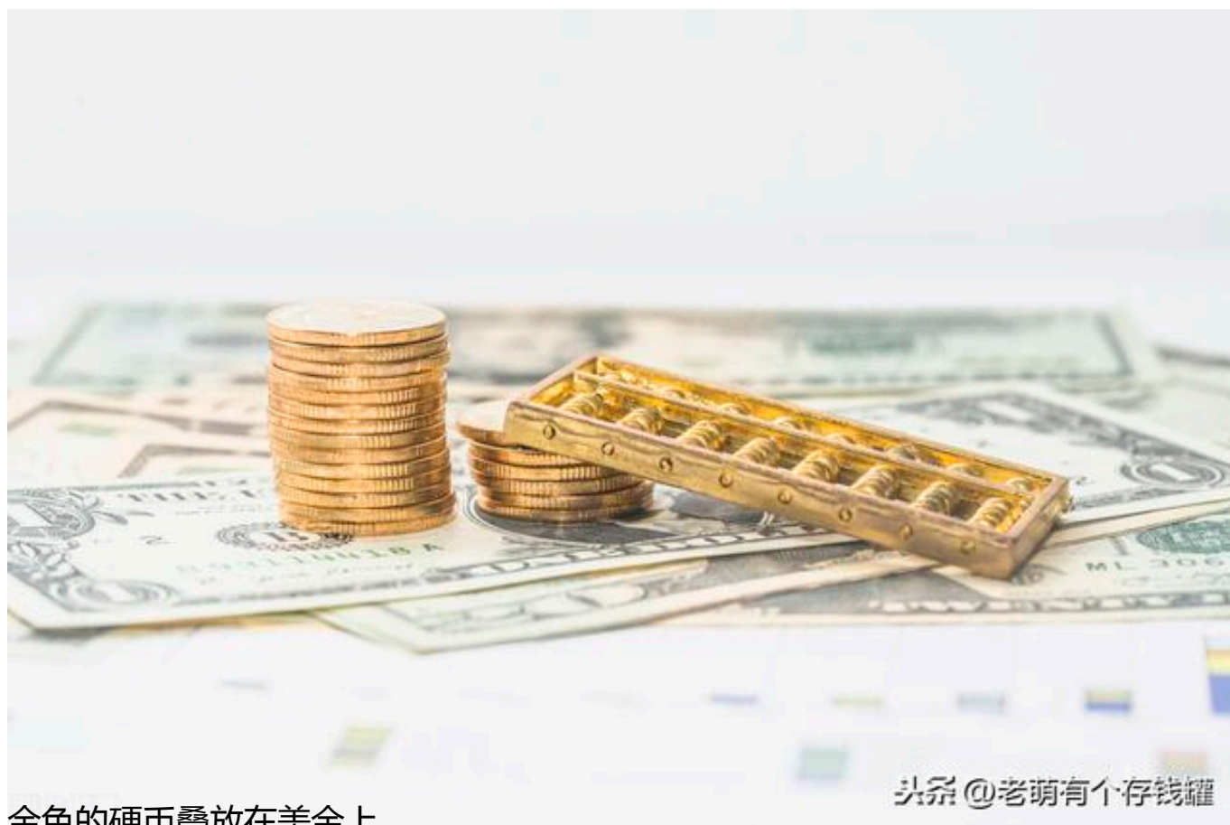
金色的硬币叠放在美金上