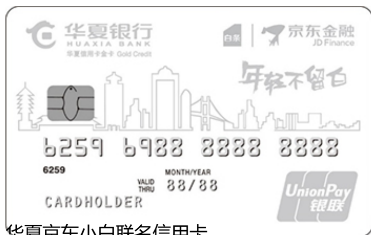
华夏京东小白联名信用卡