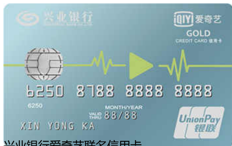
兴业银行爱奇艺联名信用卡

兴业银行：2018年12月23日前，每周五上午10：00起（11月11日除外），兴业银行信用卡用户（公务卡、外币单币种卡除外），在淘票票购买任意场次电影票，并使用兴业信用卡支付宝快捷支付，可享单笔订单5折，最高30元优惠。每活动日限量2000个，每人每月限享一次，先到先得，用完即止。