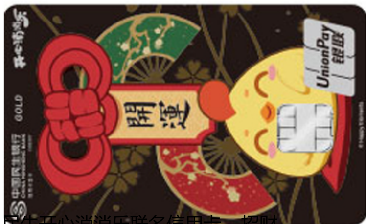
民生开心消消乐联名信用卡——招财