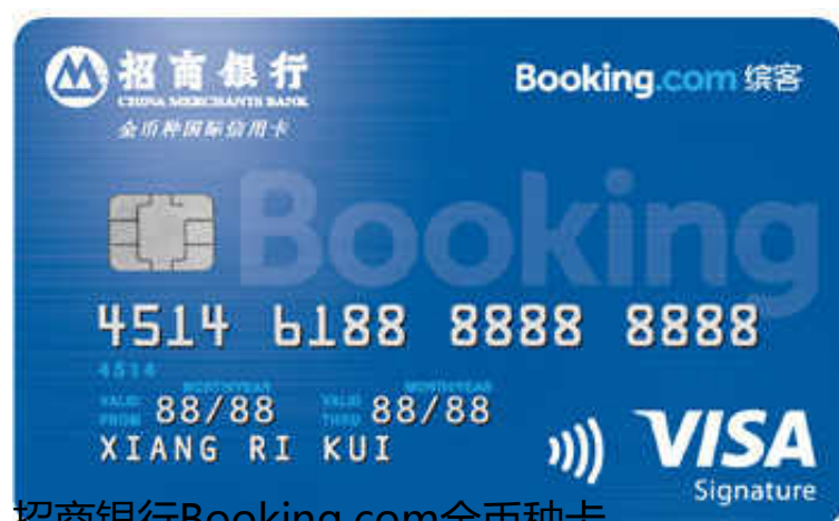
招商银行Booking.com全币种卡