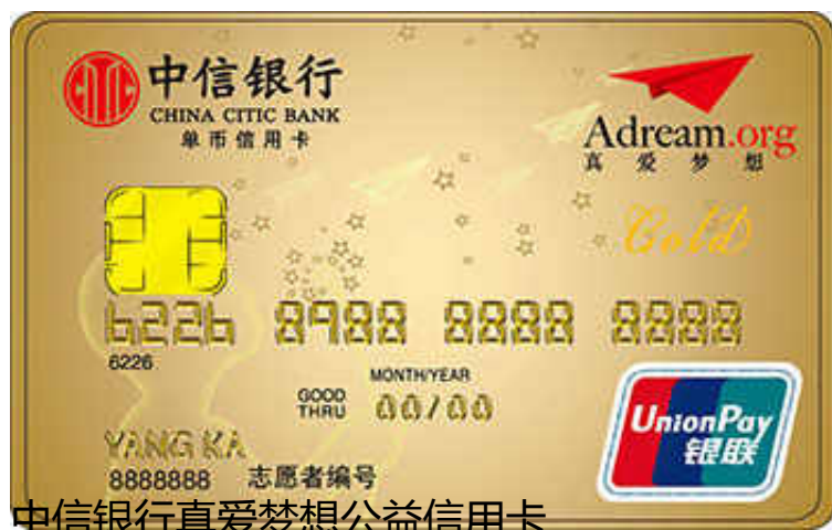
中信银行真爱梦想公益信用卡