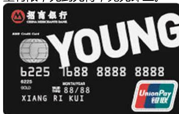
招商银行YOUNG卡青年版卡

招商银行：2019年9月1日-10月31日，用户进入活动页面，使用1000积分成功抢兑“笔笔10%刷卡金”礼券后，活动期间内在境外线下消费金额最高的支付通道（银联 / VISA / MASTER / AE / JCB），可享笔笔返现10%，最高700元。数量有限，先到先得，兑完即止。