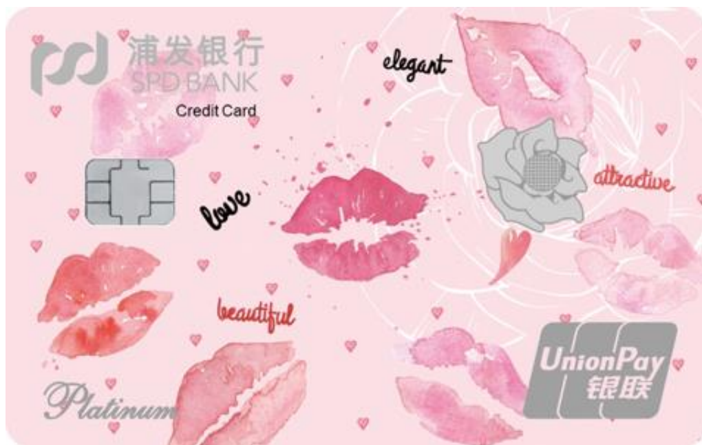
浦发银行美丽女人信用卡