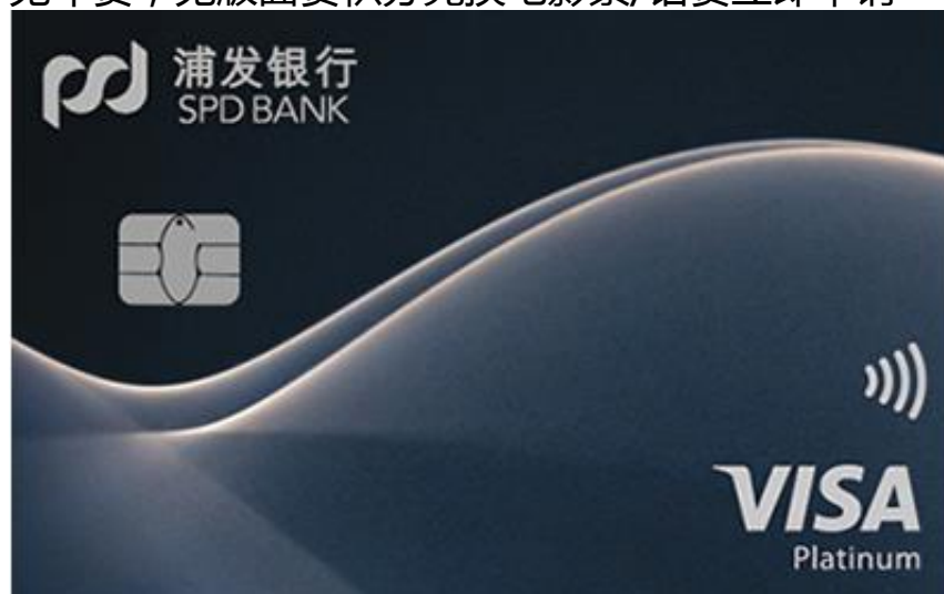
浦发银行VISA超凡白金信用卡