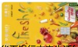
华夏银行本来生活fresh 金卡