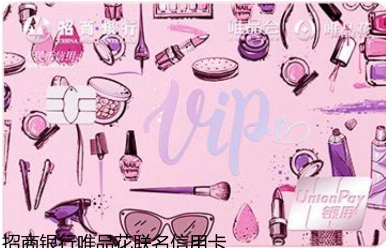
招商银行唯品花联名信用卡

新户达标赠价值1280元的DKNY挎包 激活开通“唯品花”享100元购物红包立即申请