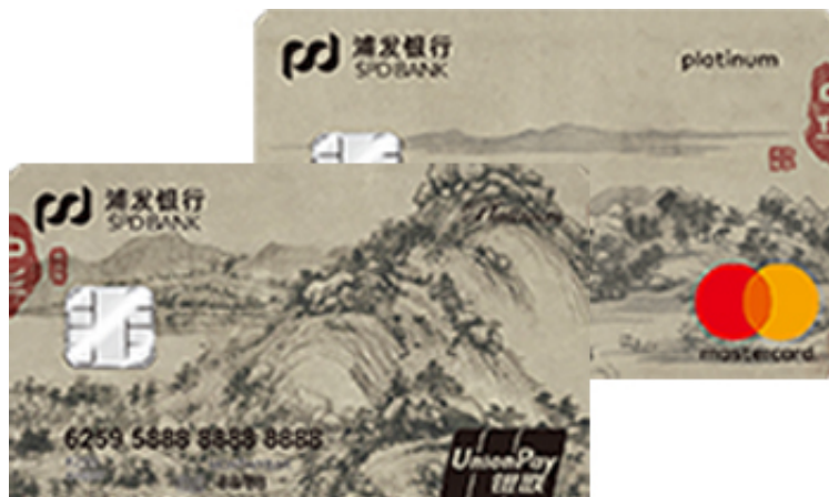
浦发富春山居图主题信用卡套卡