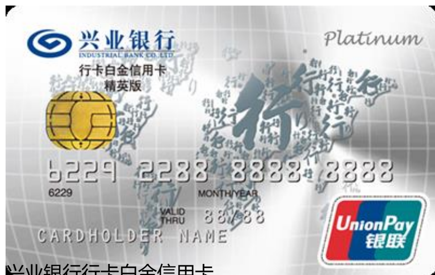
兴业银行行卡白金信用卡

2、即日起至6月30日，兴业信用卡用户在京东商城购买实物类部分商品使用京东支付，单笔满499减30元。数量有限先到先得。