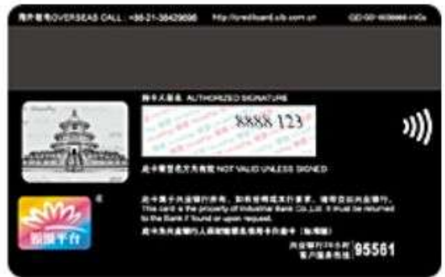
人保财险联名信用卡白金卡（标准版）