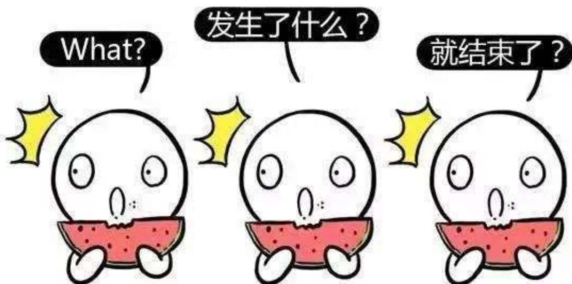
目瞪口呆的吃瓜群众1.2.3.

就这么简单，大家根据自己的权益使用时间，去兴业银行信用卡官方微信回复即可，如本文开头既明截图所示。 这就是兴业的“大坑”了，写完了。