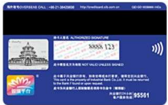
人保财险联名信用卡白金卡（精英版）