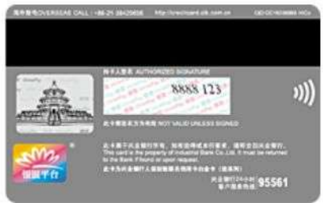
人保财险联名信用卡白金卡（悠系列）