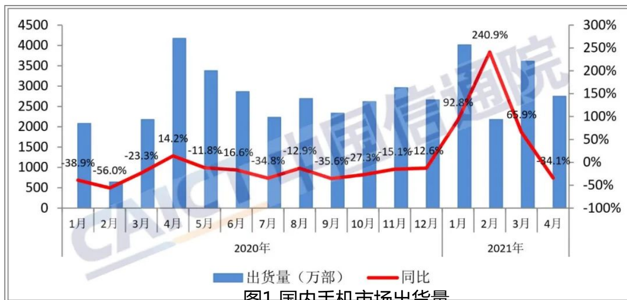
图1 国内手机市场出货量

2021年4月，国内手机市场总体出货量2748.6万部，同比下降34.1%；1-4月，国内手机市场总体出货量累计1.25亿部，同比增长38.4%。