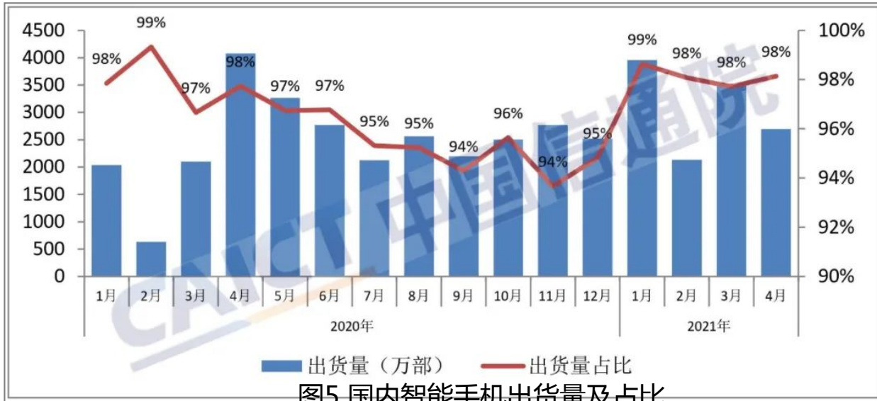
图5 国内智能手机出货量及占比

2021年4月，智能手机出货量2697.3万部，同比下降33.9%，占同期手机出货量的98.1%。1-4月，智能手机出货量1.23亿部，同比增长39.1%，占同期手机出货量的98.2%。