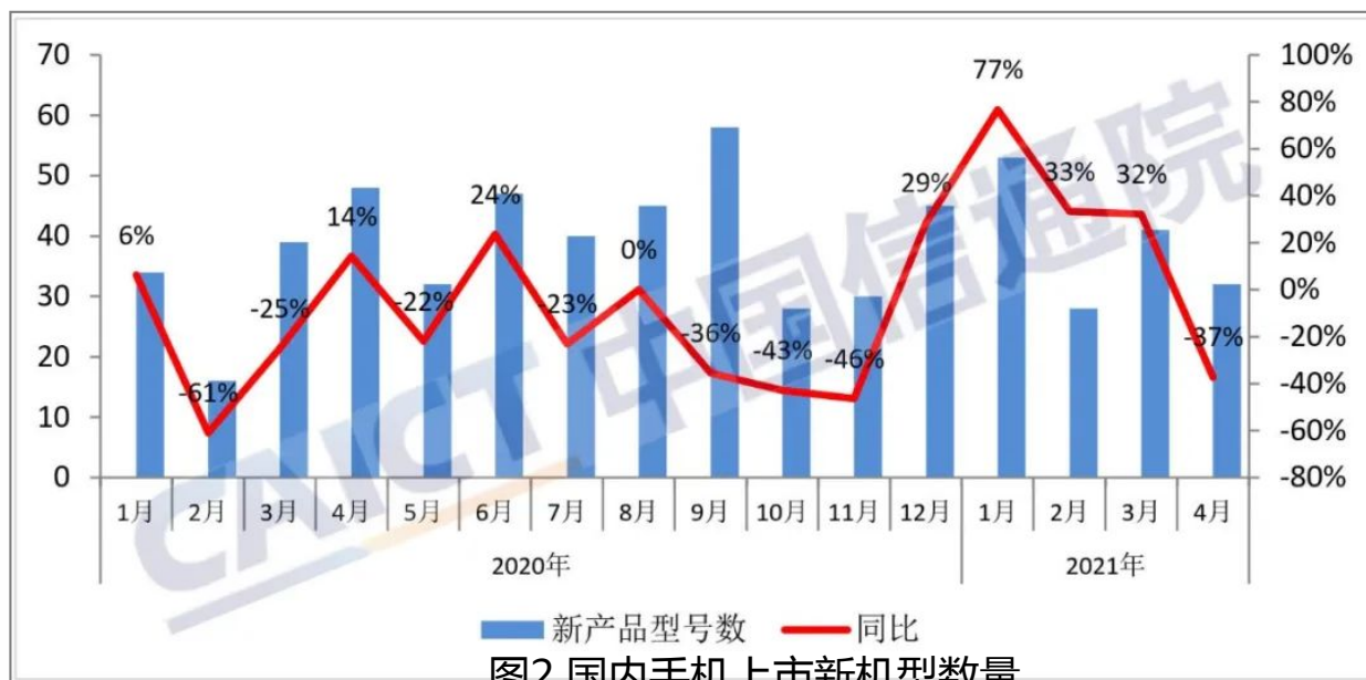
图2 国内手机上市新机型数量

2021年4月，国内手机上市新机型32款，同比下降37.3%。1-4月，上市新机型累计154款，同比增长15.8%。