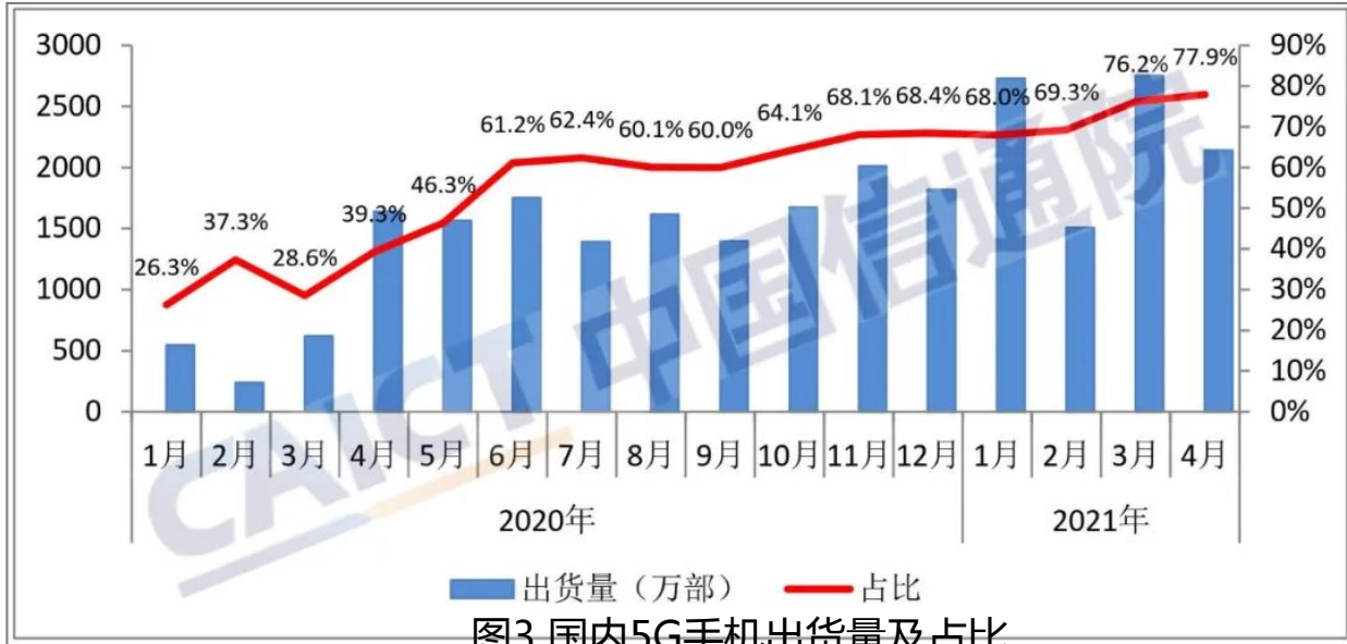
图3 国内5G手机出货量及占比

2021年4月，国内市场5G手机出货量2142.0万部，占同期手机出货量的77.9%；上市新机型16款，占同期手机上市新机型数量的50.0%。1-4月，国内市场5G手机出货量9126.7万部、上市新机型80款，占比分别为72.7%和51.9%。