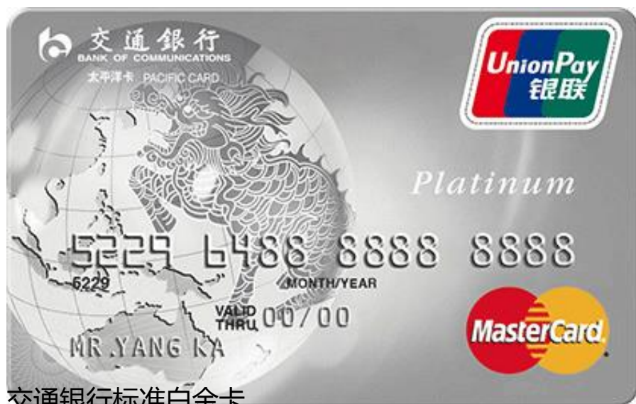
交通银行标准白金卡