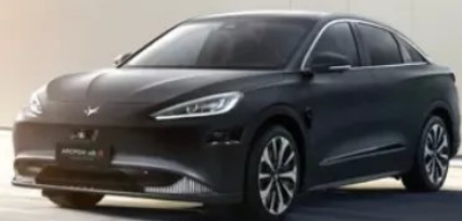
极狐 阿尔法S HI