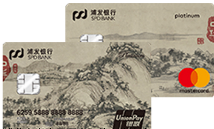
浦发富春山居图主题信用卡套卡