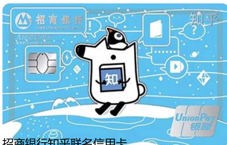
招商银行知乎联名信用卡

滴滴出行：即日起，全国滴滴出行用户可使用699积分免费兑换3个月亚马逊Prime会员权益试用，权益包括海外购订单满200元，享无限次跨境免邮、国内订单0门槛免邮、免费阅读电子书、会员专享折扣、周三会员日、7*24小时专享客服！